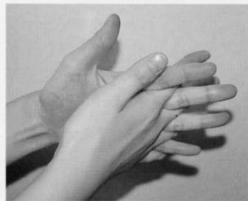
4. 指の間を十分に洗う