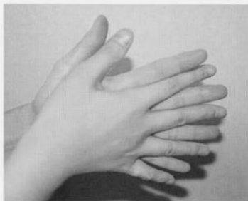
1. 手のひらを合わせ、よく洗う