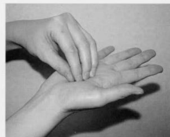
3. 指先、爪の間をよく洗う