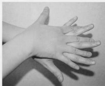
2. 手の甲を伸ばすように洗う