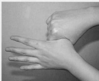
5. 親指と手掌をねじり洗いする